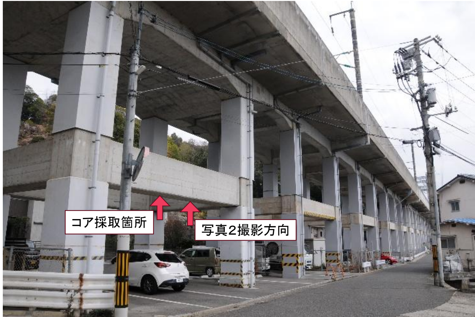
写真1 鉄筋コンクリートラーメン高架橋