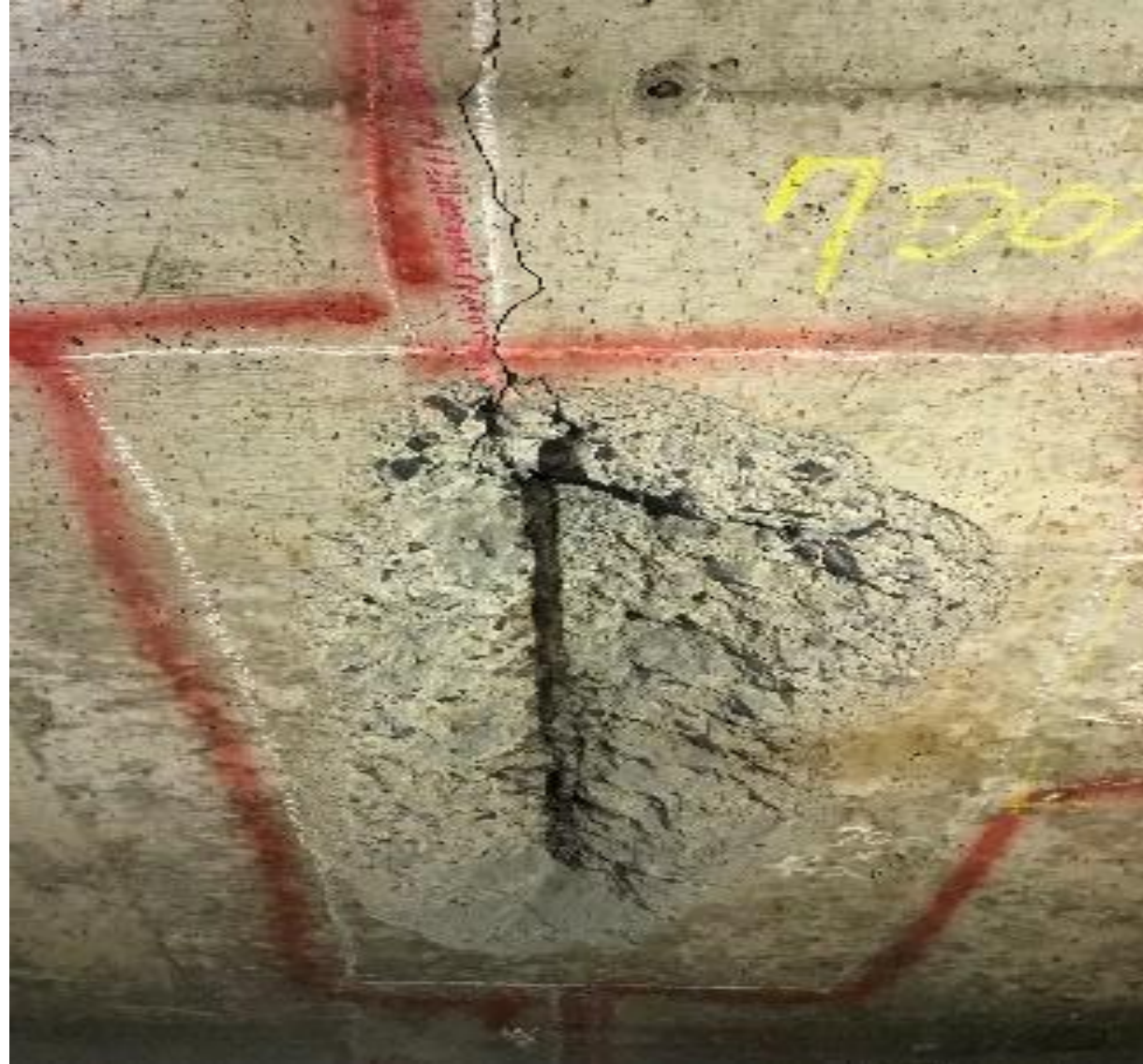
写真2 対象高架橋に発生した変状