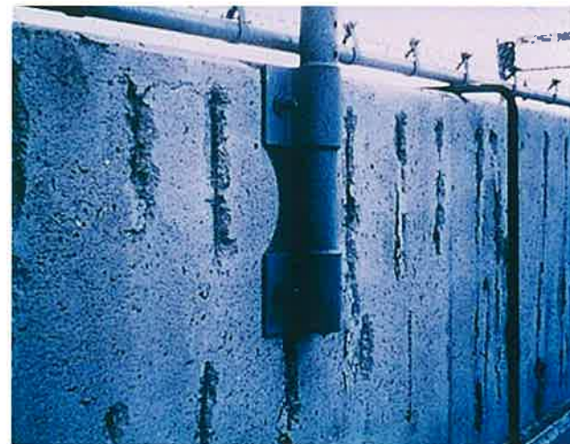
図-1 壁高欄のコンクリート剥落

中性化の劣化を見る上でのポイントは、塩害と同様にコンクリート表面に現れる様々な変状が必ずコンクリート内部の鉄筋腐食に起因している、という点です。つまり、図-1や図-2のような変状は、中性化でも塩害でも生じうるといえることです。劣化メカニズムを理解し、適切な調査・診断を行ったうえで判断することが重要です。