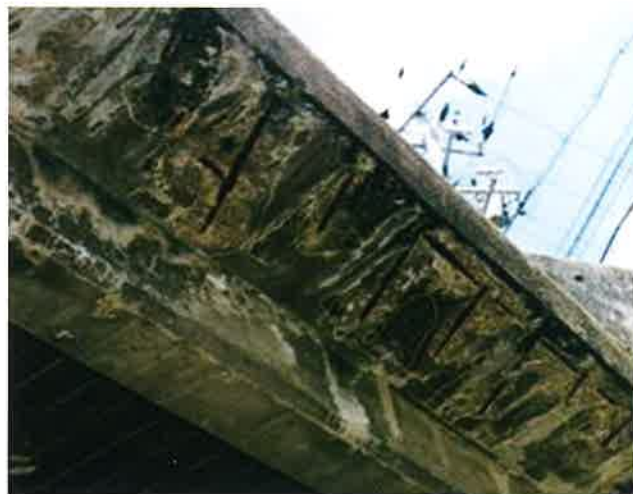
図-2 張出し床版下面の鉄筋露出

高アルカリ環境のコンクリート中にある鉄筋表面には不動態被膜が形成されていますが、pHが概ね11より低くなると不動態被膜は破壊され、鉄筋が腐食環境下に置かれることとなります(図-4)。不動態被膜が破壊された後の鉄筋腐食の進行は前回の塩害の稿でも述べたとおり、鉄筋が腐食すると腐食箇所の体積が膨張し、その膨張圧によってコンクリートにひび割れが発生します。そのひび割れを通じて水分、酸素などの劣化因子の供給が容易になると、さらに鉄筋腐食が促進され、コンクリート剥離や剥落、鉄筋の断面減少が生じ、構造物の耐久性能、耐荷性能が低下していきます。これが中性化によるコンクリート構