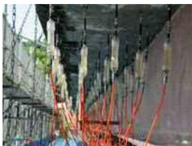
リハビリカプセル設置状況