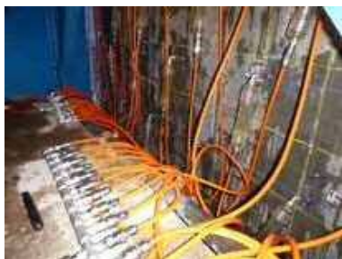
リハビリカプセル工法施工状況