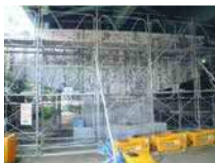
橋脚（はり部）のASR補修事例