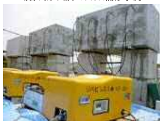
大型供試体によるASR抑制効果検証実験