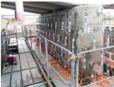
リハビリカプセル工法施工状況