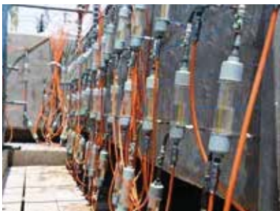
リハビリカプセル設置状況