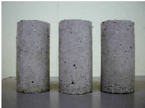
リフレアークLの硫酸浸漬試験後