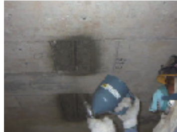
α防錆ペーストの塗布(塩害対策工法)