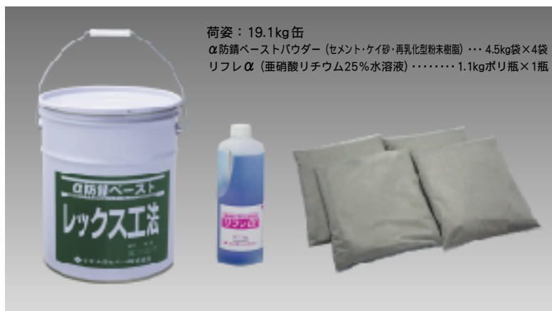
荷姿：19.1kg缶 α防錆ペーストパウダー(セメント・ケイ砂・再乳化型粉末樹脂)・・・4.5kg袋×4袋 リフレα(亜硝酸リチウム25%水溶液)・・・・・・1.1kgポリ瓶×1瓶