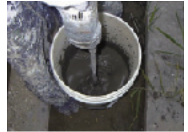
α防錆ペーストの混練