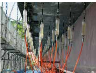
リハビリカプセル設置状況