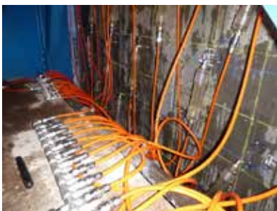
リハビリカプセル工法施工状況