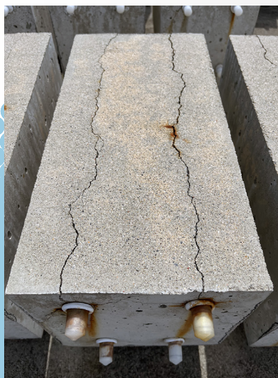
塩化物イオン10kg/m 3 、 経年数4年の供試体の例