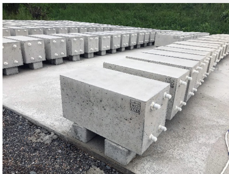
供試体外観、暴露状況 広島県世羅町にて屋外暴露中

その問題を解消するために、種々の実験を想定した様々なパターンのコンクリート供試体を製作し、広島県世羅町にて屋外暴露しています。世羅町は広島県の内陸部で塩害環境ではなく、又凍害を受ける環境でもありません。供試体製作は定期的に行い、順次暴露開始していますので、打設後1年～5年まで様々な経過年数のコンクリート供試体を選定していただけます。