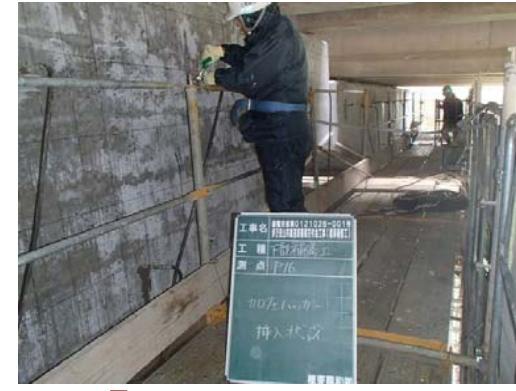
⑨ 加圧パッカー装着工