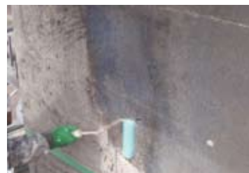
ダレが少なくローラー施工による1回塗りが可能