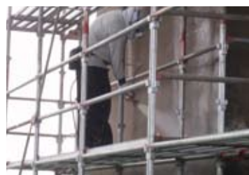
スプレーによる施工