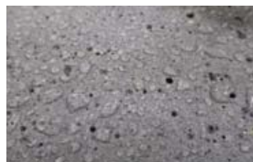
塗布面の表面の撥水状況

※3：実際の含浸深さは、施工対象コンクリート配合、施工環境及び塗布面の表面含水率等で大きく異なります。本試験結果は、弊社試験室で表面含水率が6%以下の試験体に塗布した結果です。