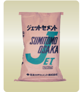
ジェットセメント