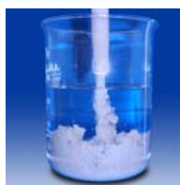
一般的なグラウト