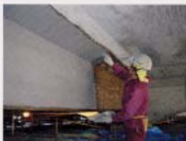
③不陸調整及び接着材下塗り