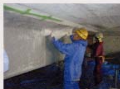
④連続繊維シート貼付工